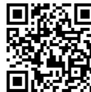
現場ホームページQRコード